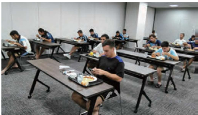
スクール形式による給仕