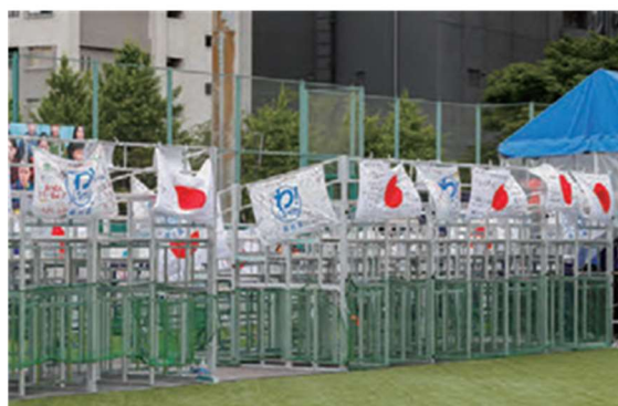
品川区の150団体のメッセージを書き込んだ応援フラッグ