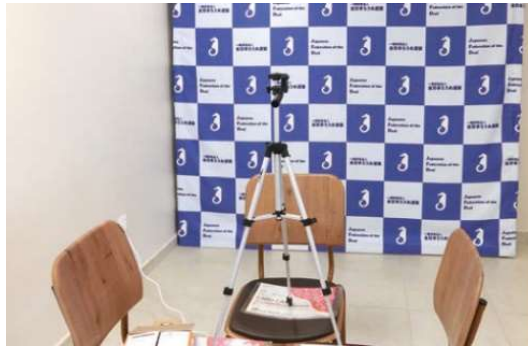
選手村 日本選手団本部事務局(左) インタビューブース(右)