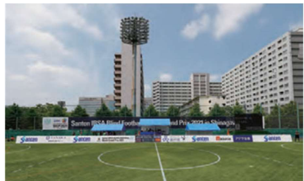
天王洲公園サッカー場