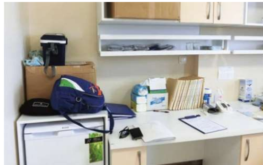
選手村 トレーナールーム(左) メディカルルーム(右)