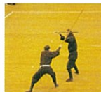
体育の日記念事業