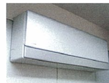
VIPルーム空調管理の見直し