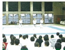
有名選手ふれあい事業(空手)