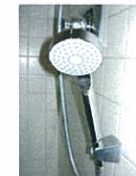
節水シャワーへの交換