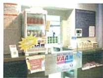
ドリンク・サブリメントの販売