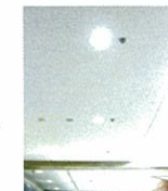
LED照明への交換(正面玄関)