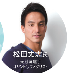
松田丈志氏 元競泳選手 オリンピックメダリスト

時間 ▶ 14:00～17:00 (13:30受付開始) 【1部】企業向け説明会 【2部】JOC「アスナビ」説明会