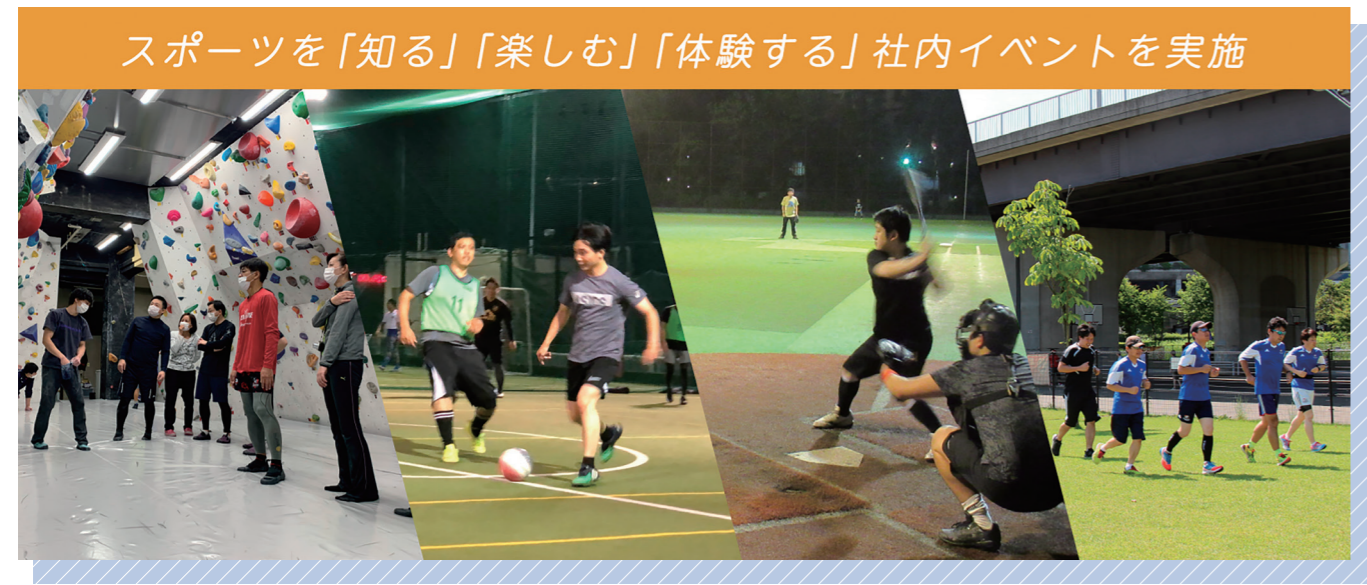
スポーツを「知る」「楽しむ」「体験する」社内イベントを実施