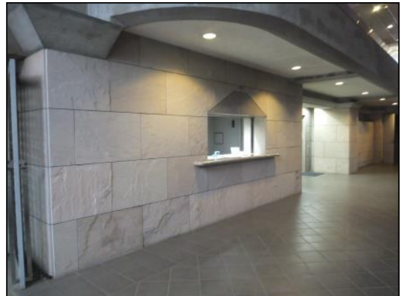
管理棟受付（地下1階）